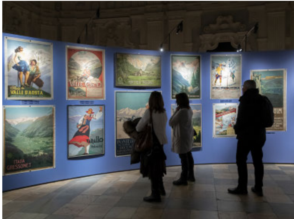
L'esposizione rimarrà aperta fino al prossimo 25 agosto

Nella prestigiosa cornice del Museo d'Arte Antica si possono apprezzare 200 opere del Novecento