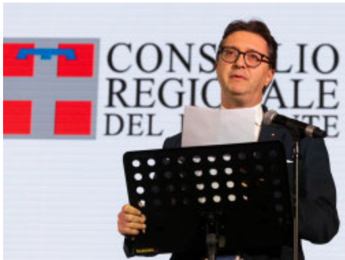
Il presidente Davide Nicco

«Ci aspettano tre giorni intensi di aula, durante i quali speriamo di concludere l'approvazione del previsionale 2025 della Regione» - afferma il presidente dell'assemblea legislativa piemontese, Davide Nicco, a proposito del