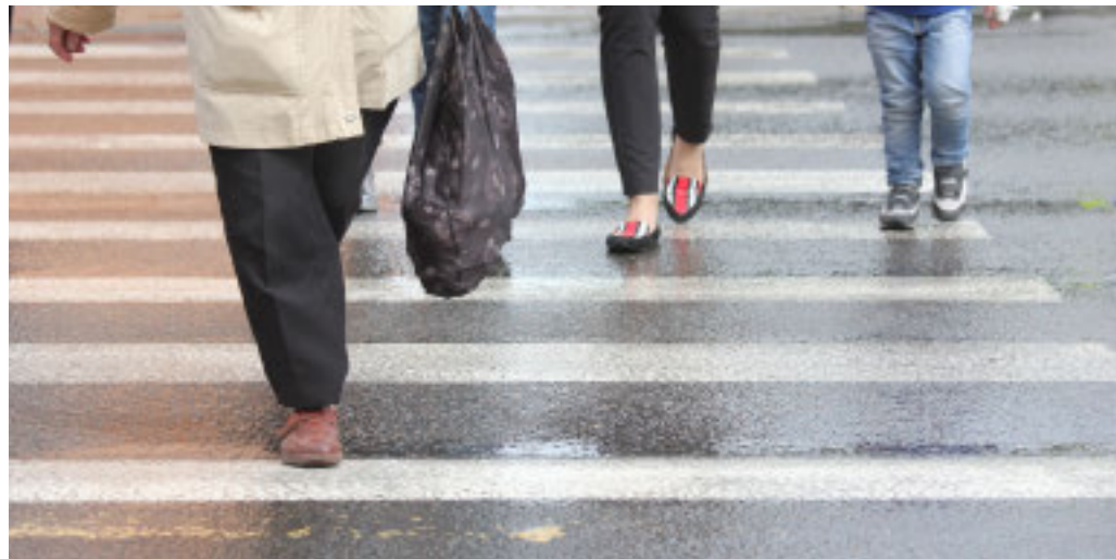
I pedoni sono sempre i più a rischio: un investimento a 30km all'ora garantisce il 90% di sopravvivenza