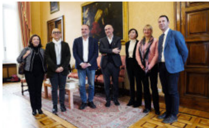
La presentazione dell'iniziativa

Presentato il progetto «Samba» per la promozione del benessere psicofisico, finanziato dal Ministero