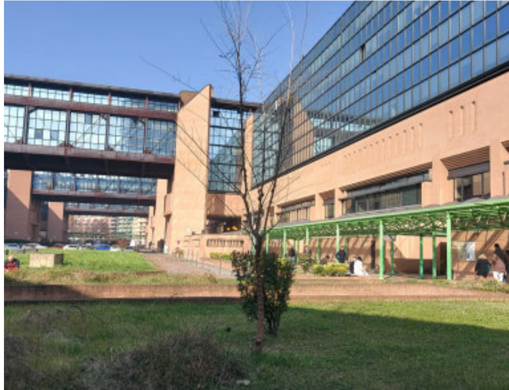
L'indagine ha tratto origine da informazioni acquisite dalla Polizia giudiziaria

La Guardia di Finanza ha notificato l'avviso di conclusione indagini a 21 persone e 4 società