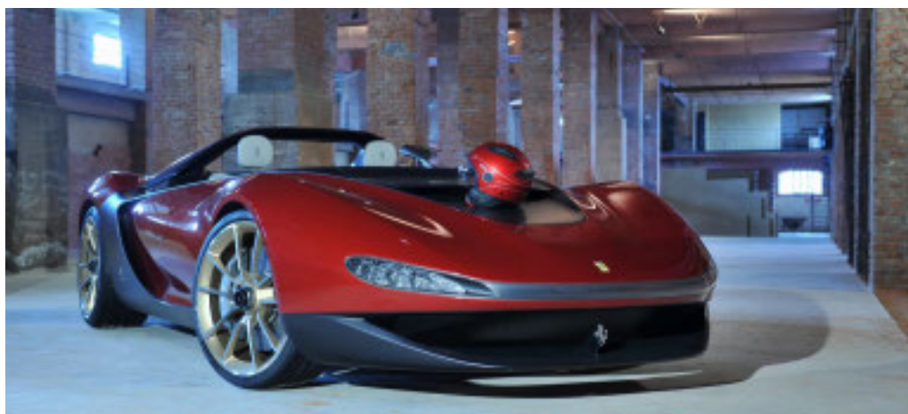
La Ferrari 'Sergio' disegnata da Pininfarina

«Nel corso delle ultime otto edizioni - aggiunge - l'Italian Design Day ha visto l'organizzazione di oltre 1.600