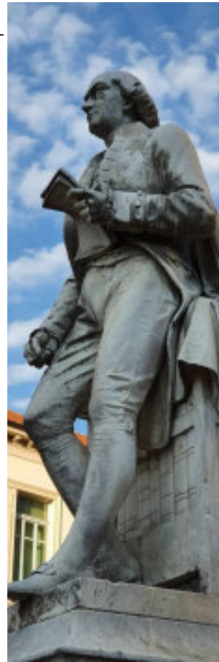
Monumento di Carlo Denina (Revello, Cn, 1731-Parigi, 1813), opera dello scultore Alfonso Balzico, donato alla città di Saluzzo dal nipote Vincenzo Denina (1874).

L'unificazione comportò la fine dello Stato pontificio. Pio IX scomunicò Vittorio Emanuele II, il governo, l'intera "macchina" del regno d'Italia. Le coscienze furono lacerate. Uomini politici e funzionari dello Stato dovettero fare i conti "in casa". Non solo negli anni più acuti del conflitto ma ancora decenni dopo anche anticlericali e massoni notori mandavano figli e nipoti a studiare in convitti religiosi. Sembrava dunque che dovesse crollare il mondo. Invece fu solo un'increspatura nel flusso della storia. Lo stesso avvenne nel 1946, quando in Italia cambiò la forma dello Stato. La sostituzione della monarchia rappresentativa ereditaria con la repubblica elettiva non mutò le fondamenta del rapporto tra l'Italia e i suoi abitanti, accomunati dalla cittadinanza, cioè dall'insieme dei loro diritti e dei doveri nei confronti delle istituzioni. E' il "popolo" a dare nerbo allo Stato, altrimenti ridotto a un contratto, che regge se rende. Il legame tra le persone e lo Stato è basato sul sentimento di appartenenza. E' come il profilo dei monti, talora avvolto dalle nubi, e il colore del mare, che muta secondo le ore e, come quello del cielo, prima o poi torna azzurro. Così, essere italiani a volte è motivo di orgo-