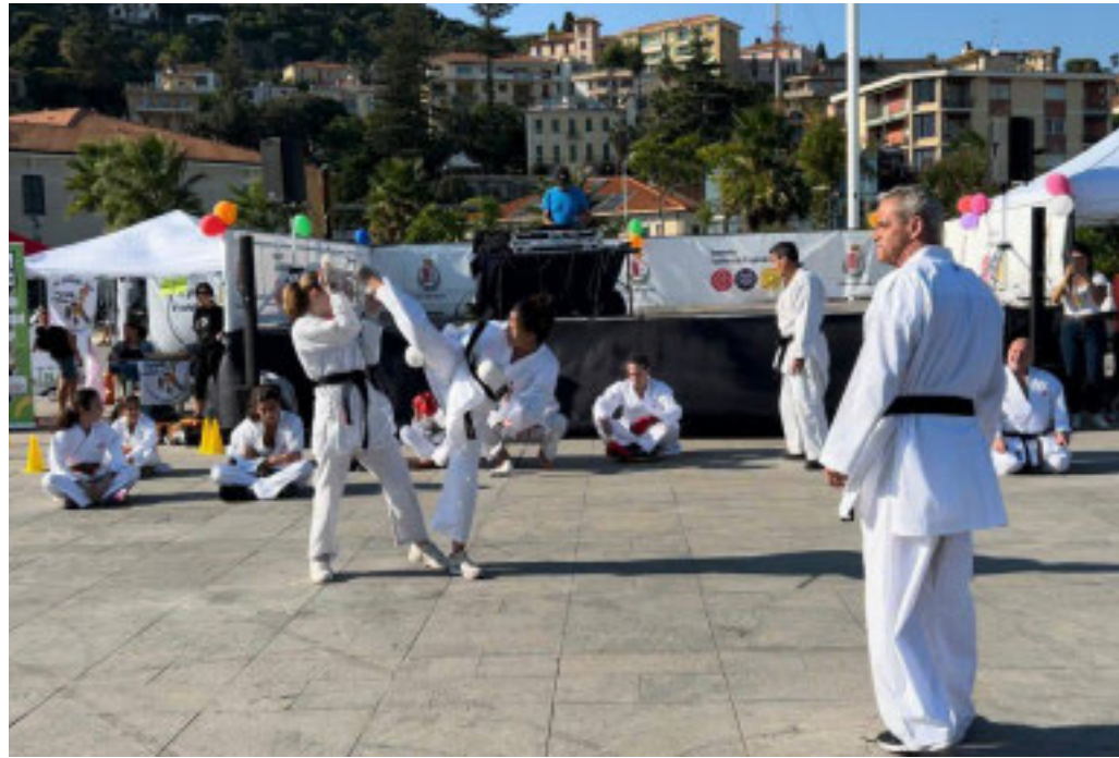
La banchina di Calata Anselmi trasformata in una grande arena sportiva