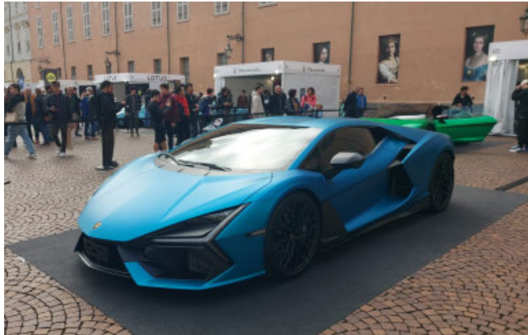
Al Salone dell'Auto di Torino sono presenti 50 costruttori

Per tre giorni la città ospita il Salone, tra folla, proteste ambientaliste e dubbi sul mercato cinese