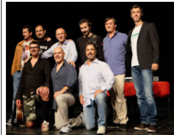
DI NUOVO INSIEME I volti noti della comicità targata Genova

La reunion segna anche l'inizio delle riprese di un docufilm