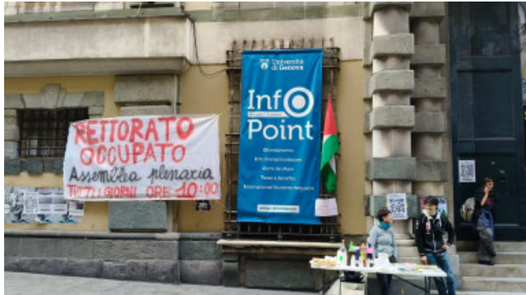
L'Università di Genova, in via Balbi 5, è occupata da studenti del gruppo Pro Pal

Parlare di «dialogo» diventa così un eufemismo. L'Università non è ricorsa a interventi di forza, ma la questione resta delicata: l'Ateneo è luogo di dibattito, non di scontro fisico. Impedire a un dipendente di lavorare, escludere la stampa, diffondere messaggi minacciosi significa imporre, non discutere. Chi protesta ha diritto di farsi sentire, ma anche la responsabilità di non oltrepassare il limite che separa la forza delle idee dalla violenza. Molti studenti si dicono a disagio per i metodi adottati: non si riconoscono in un'occupazione che rischia di trasformarsi in