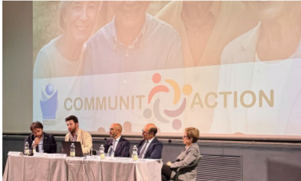
La presentazione del progetto Communit-Action ad Asti

Si tratta di un programma per mettere al centro stili di vita sani, prevenzioni delle fragilità e inclusioni