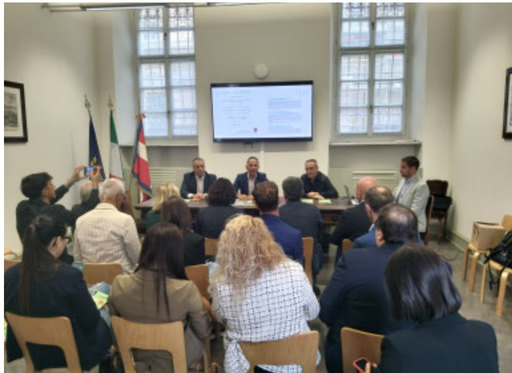
La presentazione del Galà della castagna a Palazzo Lascaris a Torino

Altre stelle sul palco frabosano domenica 5 ottobre, già dal mattino: alle 11 sempre Marino Bartoletti sarà a confronto con tre mostri sacri del ciclismo: Francesco Moser, Beppe Saronni (questi due protagonisti di un acceso e sportivamente appassionante dualismo per un decennio) e Alessandro Ballan, noto ex professionista, vincitore di un titolo iridato in linea e di un Giro delle Fianche. Pomeriggio (a partire dalle 14.30) di vero e proprio show con la consegna della Castagna d'oro a Simone Cerasuolo, medaglia d'oro nei 50 rana ai mondiali di nuoto di Singapore 2025, Sofia Raffaeli, medaglia d'oro ai mondiali di