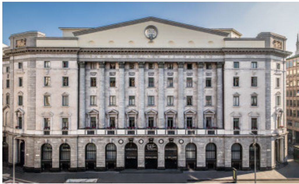
Sede della BPM