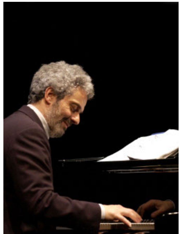
Il pianista romano Nicola Piovani

Sulla scia di memorie e aneddoti, il maestro ripercorre alcuni grandi incontri che hanno segnato la sua carriera, da Federico Fellini, ricordato con affetto per le piccole manie e per la maestria di regista, dai Taviani a Vincenzo Cerami e Roberto Benigni, attraverso episodi narrati con leggerezza e sincerità. Esperienze di vita tra musica, cinema, teatro che Piovani racconta accompagnandole con le note del suo pia-