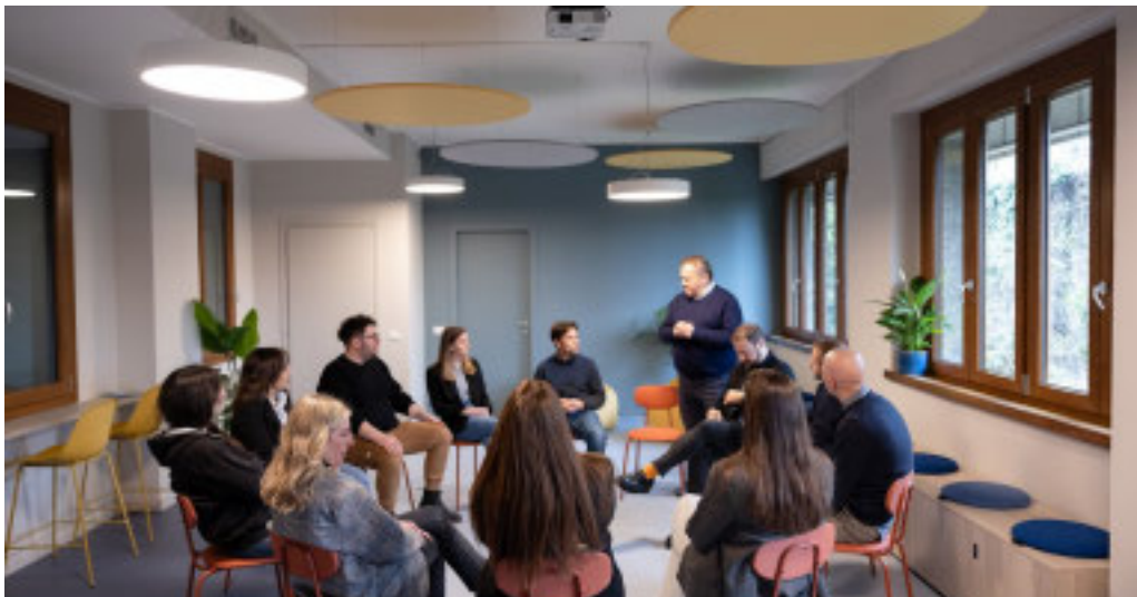
Foto di un incontro di Centro Re.Te

Un Centro polifunzionale, a pochi passi dalla stazione Centrale del capoluogo lombardo, dove sport, arte, dialogo e incontro abitano insieme in una struttura mo-