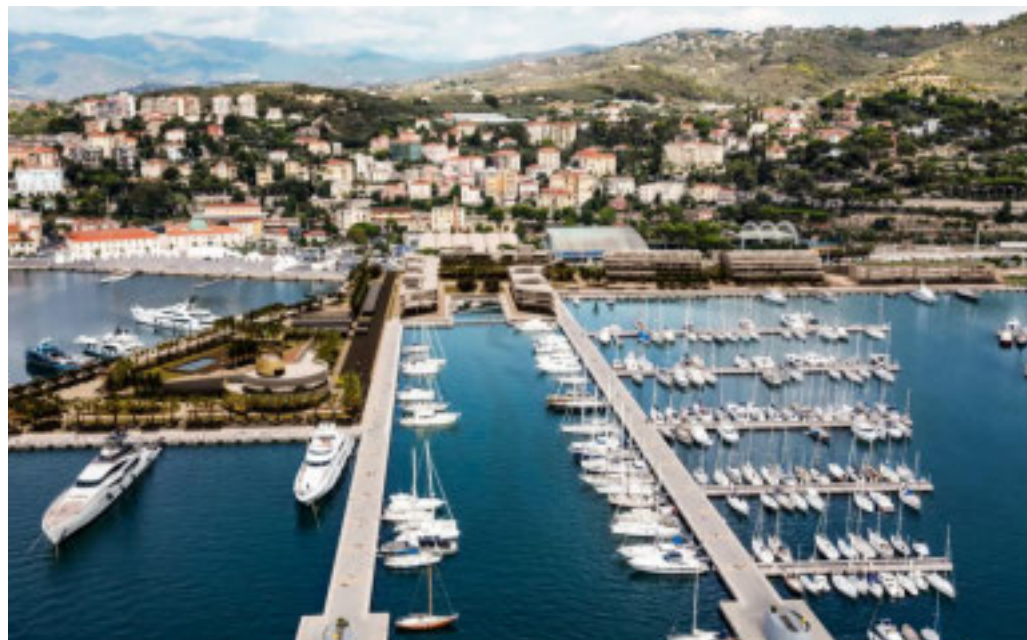
Il rendering del futuro porto turistico del capoluogo della Riviera dei Fiori

gere un nuovo piano economico-finanziario e approvare un nuovo progetto di completamento. A questo si è aggiunta la positiva conclusione del complesso incameramento delle opere da parte del Demanio dello Stato. Nel luglio 2024 era stata convocata la Conferenza dei Servizi per l'approvazione del progetto e il rilascio della nuova concessione pluridecennale, ma l'iter si era interrotto a causa della mancata conclusione della VIA, ferma dal 2013. Da allora, Comune e Go Imperia hanno lavorato per produrre e integrare tutta la documentazione richiesta, portando oggi alla conclusione positiva dell'iter con la firma del decreto ministeriale.