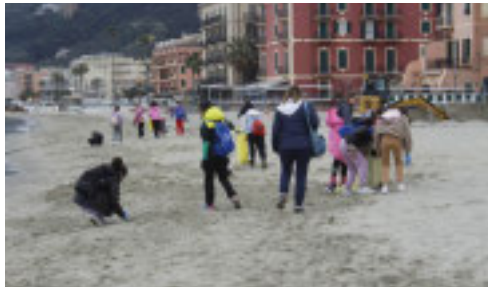
Volontari impegnati nella pulizia della spiaggia