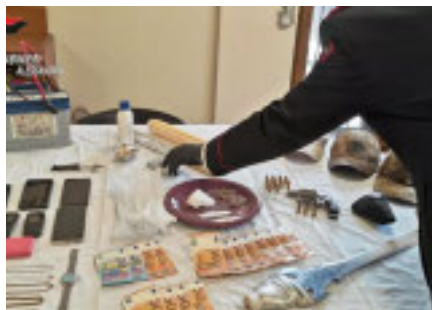
Il materiale ritrovato nel bivacco

L'intervento è scattato dopo un'articolata attività info-investigativa durata diversi mesi. Preziose le segnalazioni dei residenti, insospettiti da un insolito via vai. I militari hanno fatto irruzione in una tenda da campeggio nascosta fra la vegetazione che veniva usata come base operativa e ricovero di fortuna per controllare il territorio e impedire