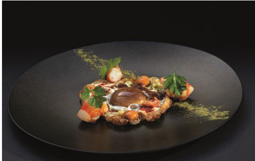
Grande attesa per l'evento internazionale

Il capoluogo piemontese sarà al centro della scena gastronomica mondiale con l'evento di questa sera