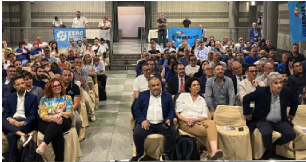
In sala erano presenti oltre 150 persone

«Un primo tema - ha affermato - è proprio quello della responsabilità del committente e della catena dei subappalti». Ha poi criticato il sistema della 'patente a crediti': «come è stata fatta non funziona. Dobbiamo dirlo e dobbiamo cambiare quello strumento». Ha quindi ribadito la necessità di salvaguardare il sistema della bilateralità e di favorire la corretta rappresentanza.