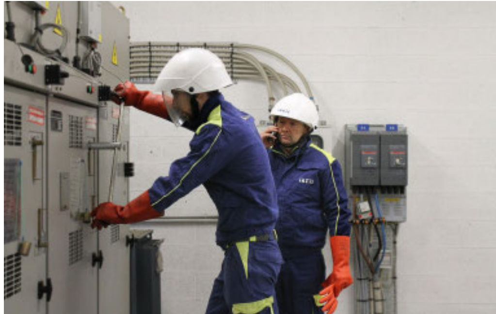
Attualmente, tra dipendenti di Ireti e delle ditte appaltatrici, sono al lavoro oltre 130 operai

Ireti ha subito attivato una task force dedicata, ma Codacons annuncia l'avvio di una «class action»