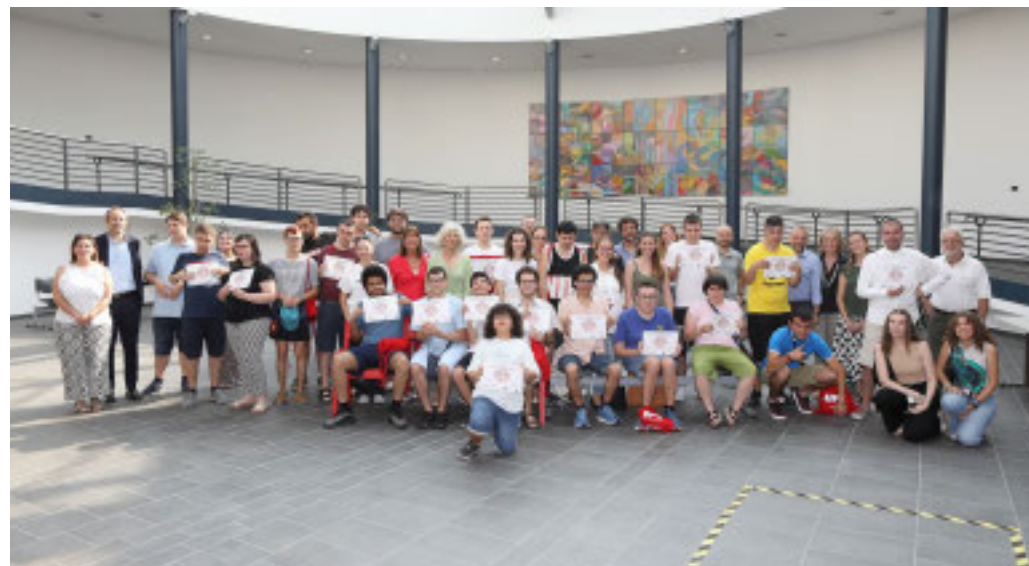
Il momento conclusivo del progetto «Autismo e tecnologie digitali»

degli educatori per Aias Alessandria, evidenzia: «Nel progetto, il ruolo degli 8 educatori è centrale: con-