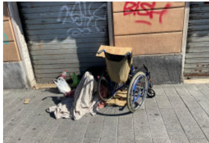
Bivacchi notturni e diurni, resti di cibo e siringhe usate, rapporti sessuali consumati tra le auto per una dose: benvenuti nei vicoli

vacciate dentro le auto o nei vani delle scale e minacciano chi gli si avvicina. La paura non è più un sentimento passeggero: è diventata una condizione di vita.