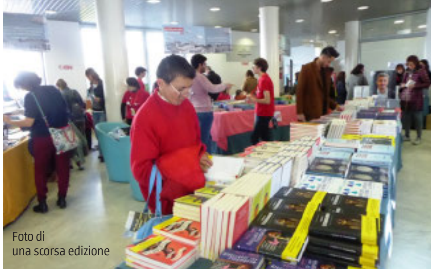
Foto di una scorsa edizione