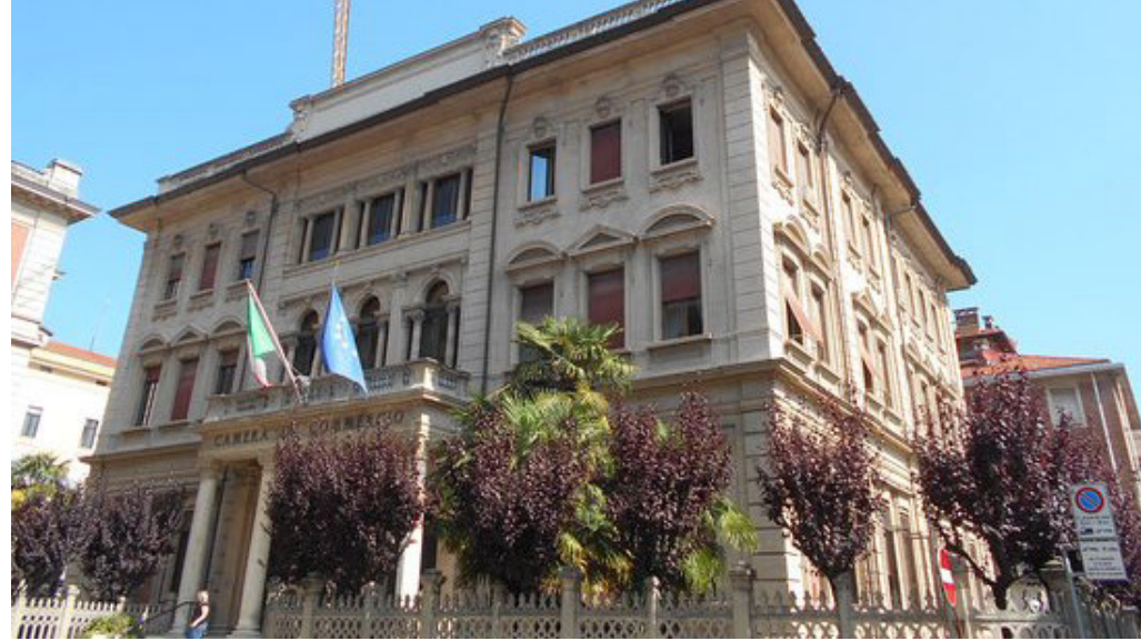
La sede della Camera di Commercio a Cuneo

La Camera di Commercio pubblica i prezzi delle uve da vino DOC e DOCG, delle nocciole, della frutta e delle principali derrate agrarie