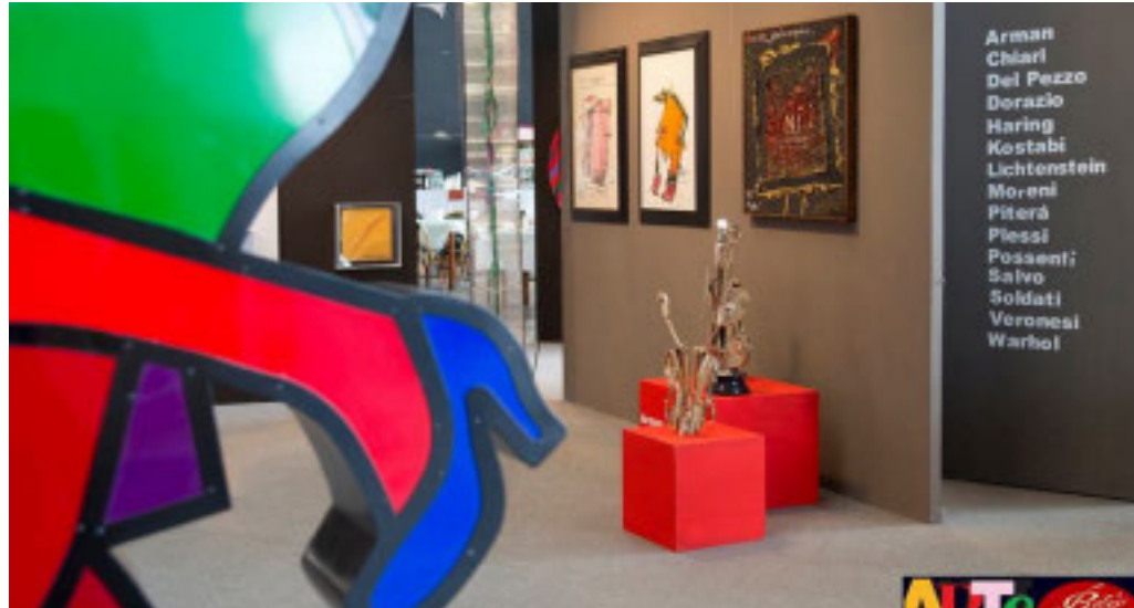
Sono ormai moltissime le edizioni di Arte Genova, segno che l'evento conquista sempre il pubblico

In esposizione più di 5mila opere portate da 150 espositori che presentano artisti riconosciuti a livello mondiale. Capolavori che aiutano a far emergere anche tante meritevoli nuove leve del panorama artistico italiano (figure in