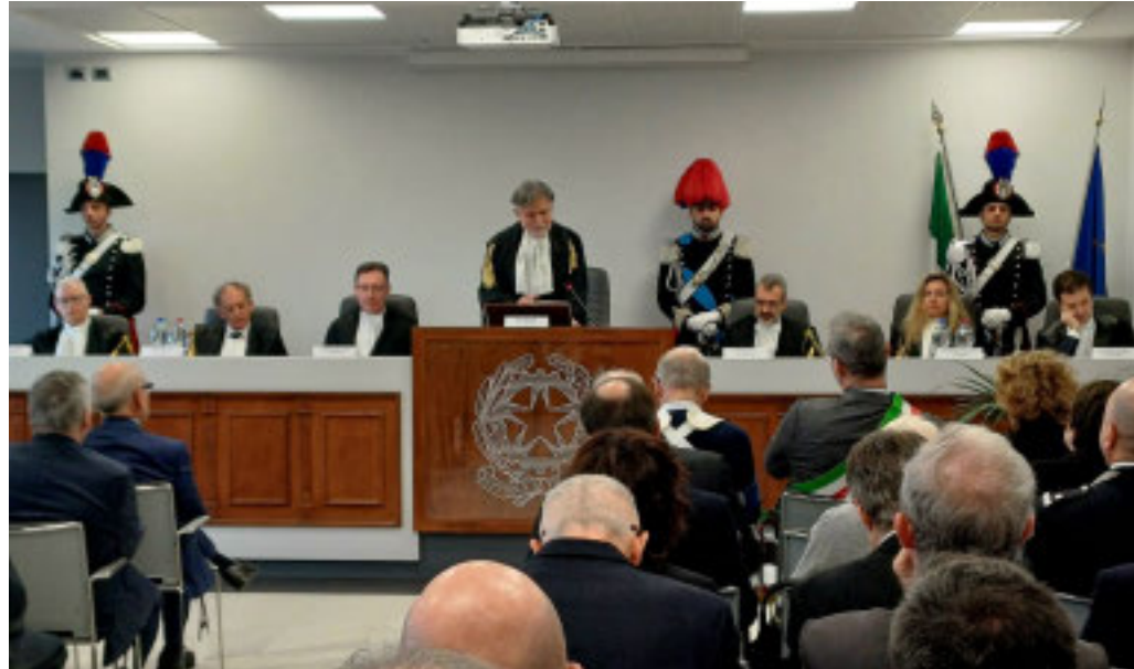
Urbanistica, edilizia, ma anche scuola ed enti locali tra gli argomenti delle cause discusse davanti al Tar

È quanto emerge dal consuntivo 2024 dei casi trattati dai giudici amministrativi: l'incremento è del 47% sul 2023