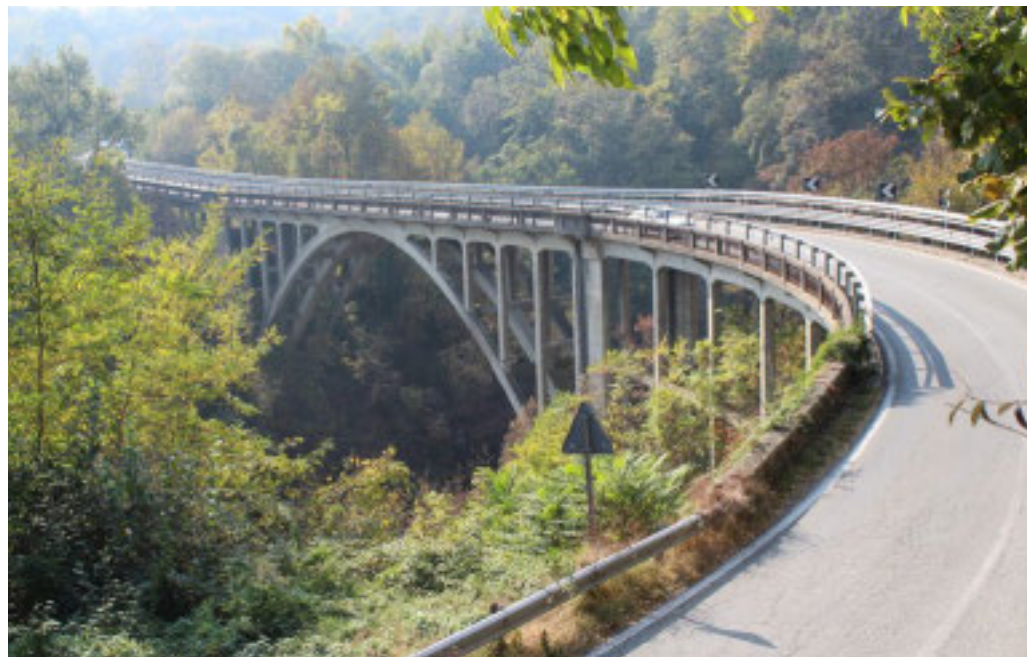
Il ponte Preti, fondamentale per la viabilità nel Canavese

Fratelli d'Italia e Forza Italia esultano per grande risultato raggiunto nella Commissione Trasporti