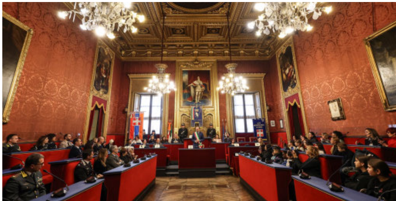
A Torino, l'iniziativa istituzionale si è tenuta nella Sala Rossa del Municipio

Un ringraziamento per il contrasto alle mafie e il lavoro quotidiano che svolgono per la legalità