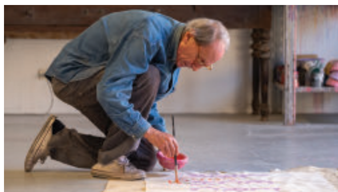
Giorgio Griffa al lavoro nel suo atelier

Griffa nasce a Torino nel 1936 e inizia a dipingere da bambino. È da subito uno dei protagonisti nel dibattito che nasce dall'Informale e si fa strada tra la Pop Art, il Minimalismo e l'Arte Concettuale. Percorre così i primi passi del suo personale sentiero d'artista, accanto agli amici dell'Arte Povera con cui condivide il rispetto e l'interesse per l'intelligenza della materia. Dopo più di cinquant'anni di carriera e tredici cicli di pittura, il percorso di Griffa rimane unico, al di fuori di una corrente specifica. Nelle collezioni e musei nel mondo, dalla Tate Modern al Centre Pompidou, i suoi segni e i suoi colori sono altamente riconoscibili: una cifra che passa con continuità e coerenza, vitalità e poesia da un'opera all'altra