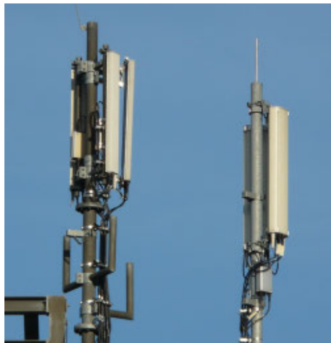
Antenne telefoniche, sono sempre di più e serviva regolamento

lazioni e le criticità relative agli impianti 5G e con gli uffici comunali siamo entrati nel vivo di un argomento complesso, che concedeva margini di intervento molto risicati e postumi. Con questo regolamento il Comune invece potrà avere a tutti gli effetti voce in capitolo in una fase preventiva anche per presidiare gli impatti potenziali ed effettivi delle installazioni sul territorio e sulla salute dei cittadini». Il regolamento arriva in risposta alle richieste dei cittadini, spesso riuniti in comitato, di mettere un freno a situazioni definite