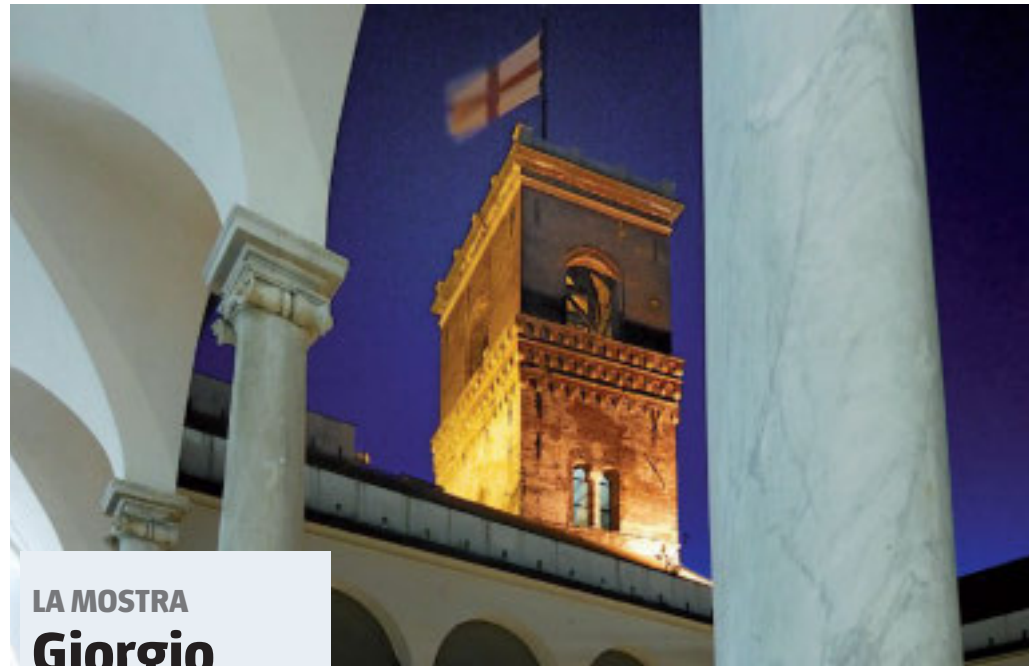
Un'immagine della Torre Grimaldina