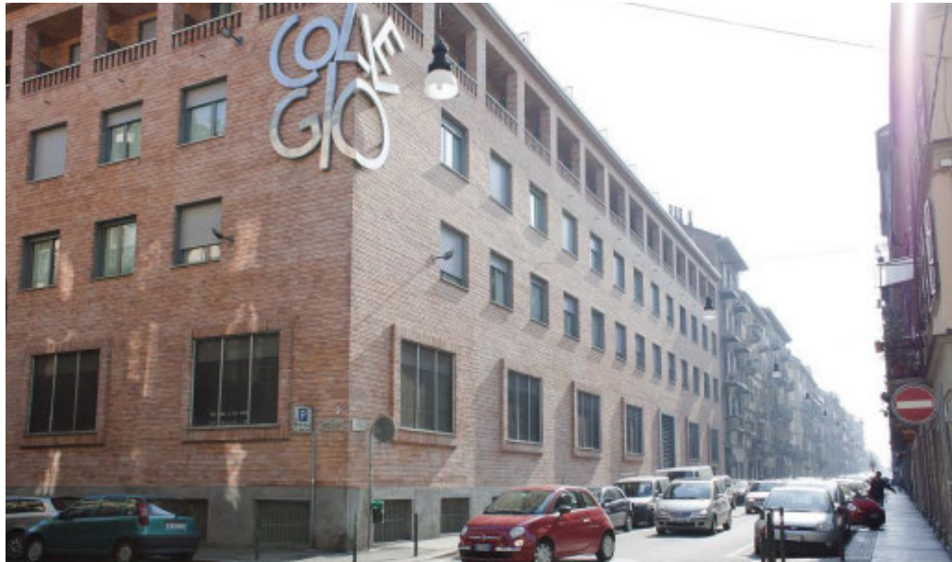
Nuovi posti per studenti e studentesse nella sezione «Valentino»

Tra i sostenitori già citati si aggiunge anche Intesa Sanpaolo, con il progetto Formula Spazio al merito, selezionato nell'ambito del Programma Formula della Banca, in collaborazione con Cesvi. Il progetto, attivo sulla piattaforma di crowdfunding 'ForFunding', ha l'obiettivo di raccogliere centomila euro entro il prossimo 30 aprile per contribuire alla realizzazione di nuovi