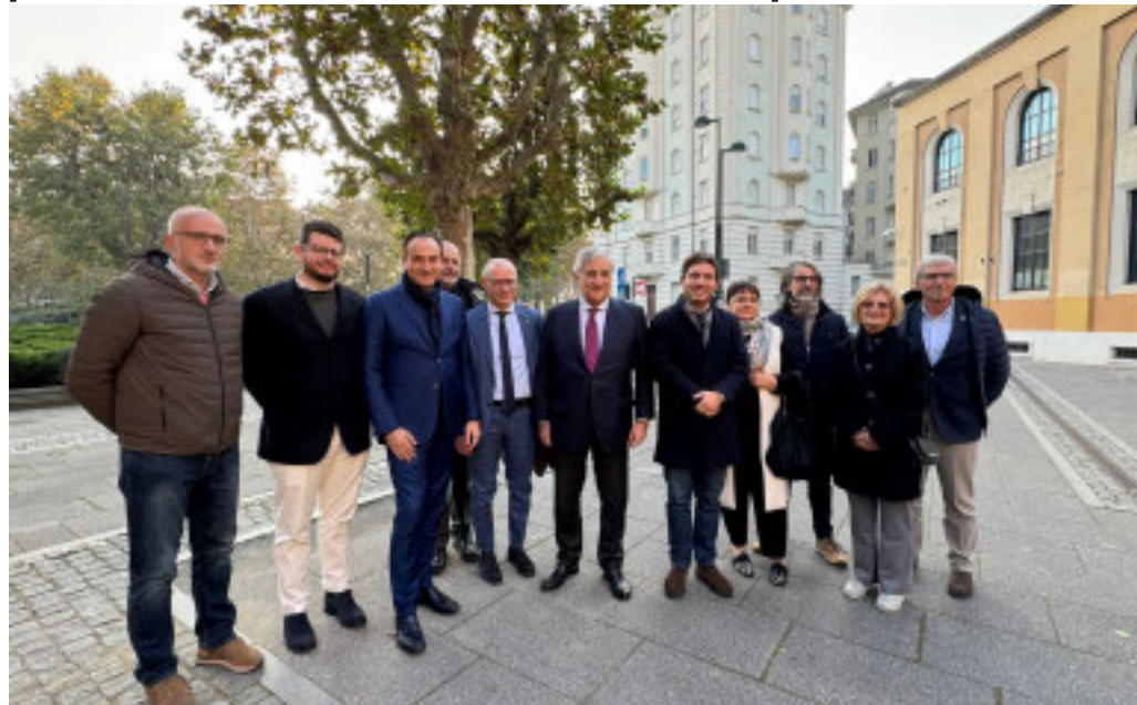
Pietrasanta vicino all'on. Antonio Tajani. Con loro il presidente Cirio tra i tanti amministratori

Sindaci e amministratori entrano in massa nel partito, al centro l'amore per il territorio