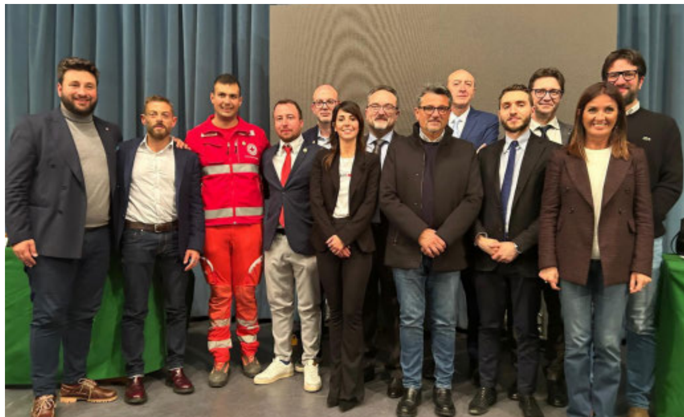
Le autorità e i relatori intervenuti all'iniziativa voluta dall'Amministrazione comunale

«È una grande soddisfazione per tutti noi - ha concluso - vedere la buona riuscita dell'evento e la concreta sensibilità delle Istituzioni, qui presenti con importanti figure della sanità regionale, e non solo».