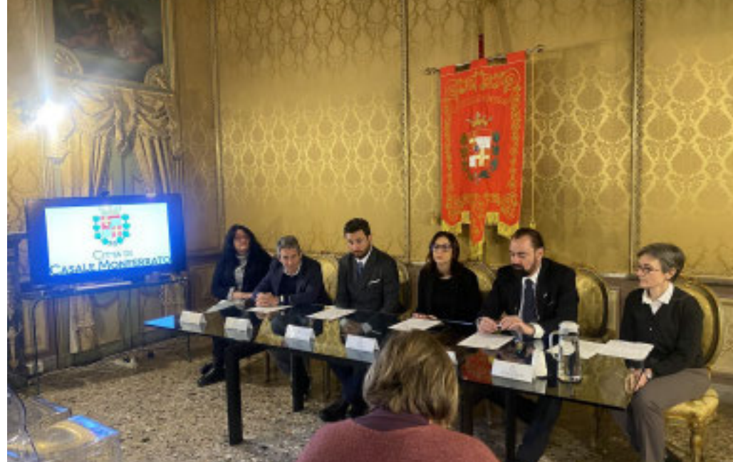
Un momento della presentazione del progetto

L'iniziativa, la cui prima fase partirà da gennaio, è sviluppata dal Comune, dall'Asl Alessandria e da Anffas