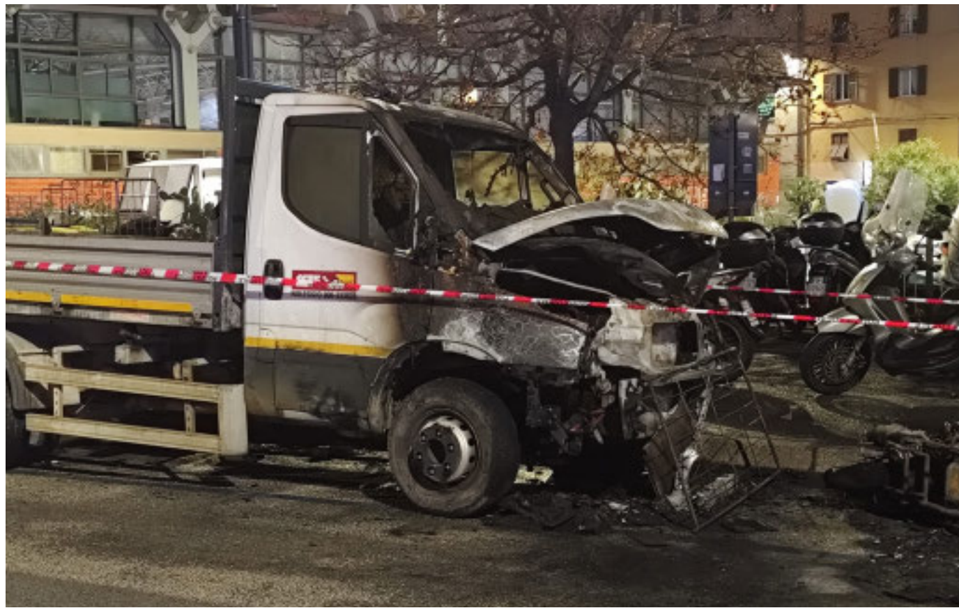
Auto bruciate o danneggiate dai tifosi violenti

Mentre le indagini proseguono e si attendono i primi provvedimenti, resta il segno profondo lasciato da una domenica di violenza che ha colpito agenti, cittadini e un intero quartiere. Un episodio che riapre con forza il dibattito su sicurezza, prevenzione e responsabilità, e che per Genova rappresenta l'ennesimo campanello d'allarme.