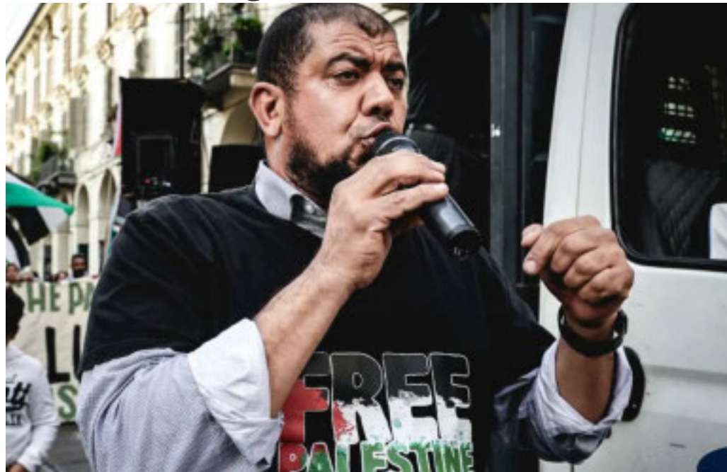
Non si placano le polemiche sulla figura dell'imam di San Salvario

Il Pd pronto ad «accoglierlo a braccia aperte» come «uno di famiglia». Per FdI si «normalizza l'odio»