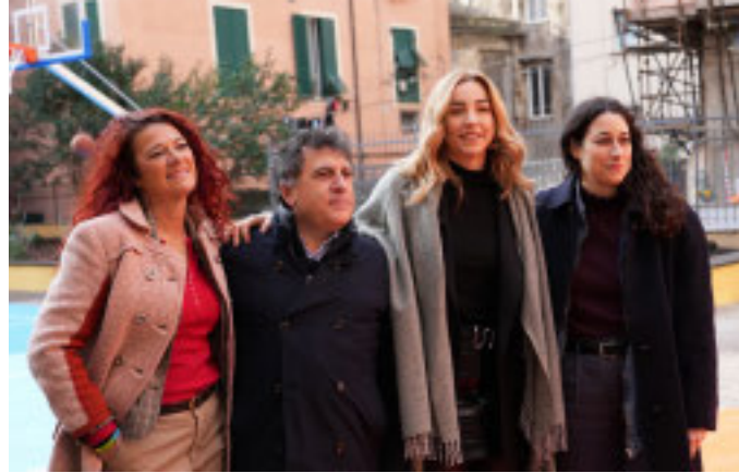
Gli amministratori all'inaugurazione

«Sono spazi che ritornano alla cittadinanza, a disposizione di chi abita questi luoghi e di chi da ora li vorrà frequentare per fare attività sportive o culturali all'aperto - dichiara la sindaca di Genova Silvia Salis - È fondamentale arric-