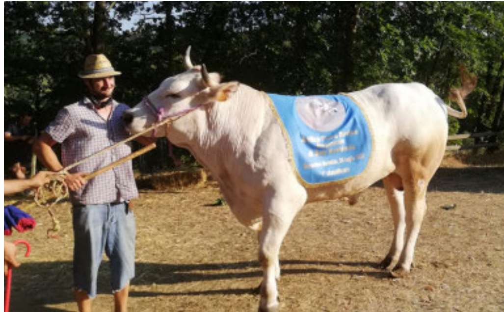
Uno degli esemplari che si potranno ammirare in fiera

La manifestazione, che si svolgerà domenica 27 luglio, è l'edizione numero 194: bancarelle, stand gastronomici e cena a tema