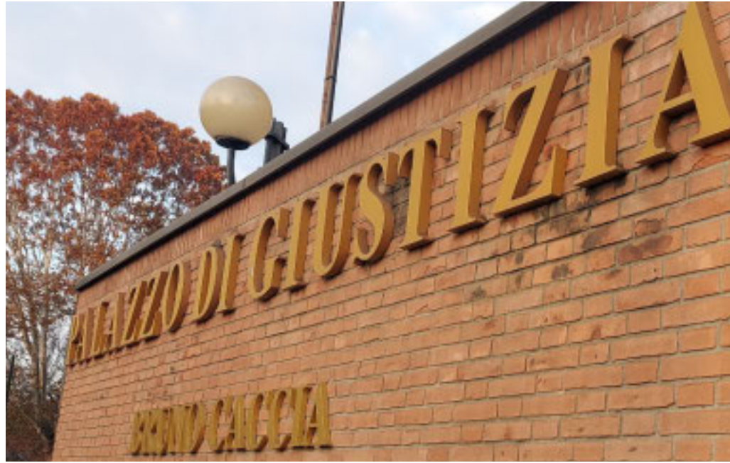
Forza Italia attende di conoscere la posizione del Pd al riguardo

Il procedimento era stato aperto nel 2023 e riguardava condotte inerenti alla gestione dei pagamenti pubblici per servizi erogati dalla società nel periodo in cui Laus vi aveva un ruolo. Gli indagati risultano in