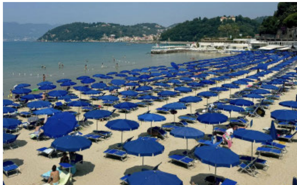
In Liguria chi può permetterselo cerca di acquistare una casa vista mare

Prezzi in crescita ad Arenzano e Rapallo, stabili ad Alassio e a Lerici: tanti i clienti dal Nord Europa