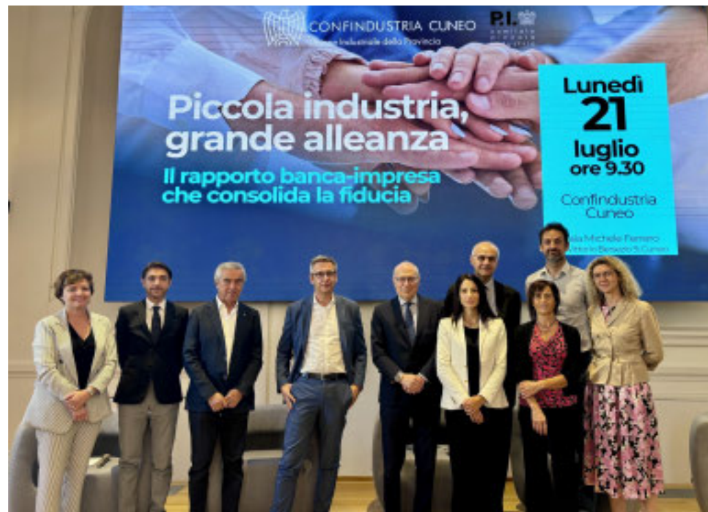
I partecipanti al convegno