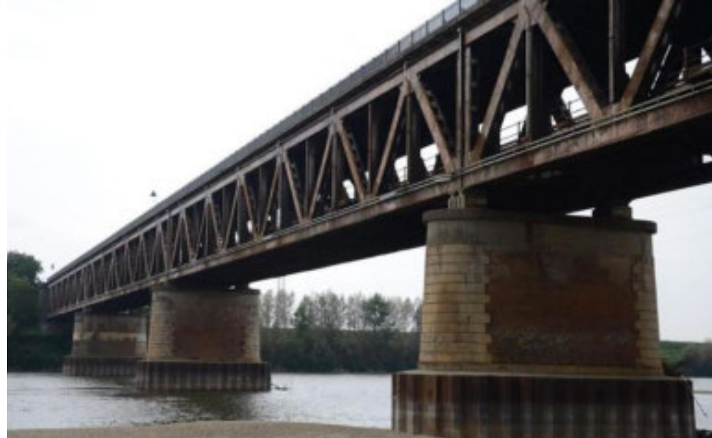
Il ponte sul Po interessato dai lavori che comporteranno inevitabili disagi

Al via un intervento delicato che comporta l'interruzione completa del transito dei treni