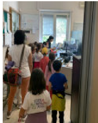
I bambini in visita alla centrale

Al termine della piacevole visita, i bambini hanno donato al Comandante del Distaccamento in segno di gratitudine e ringraziamento dei disegni loro dedicati