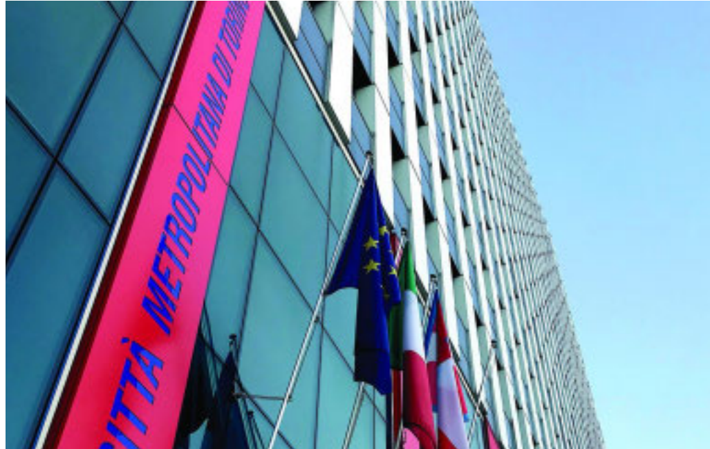
La sede del nuovo Distretto sarà presso la Città Metropolitana di Torino

Venerdì prossimo il Consiglio Metropolitan voterà la sua istituzione, che coinvolgerà ben 78 Comuni