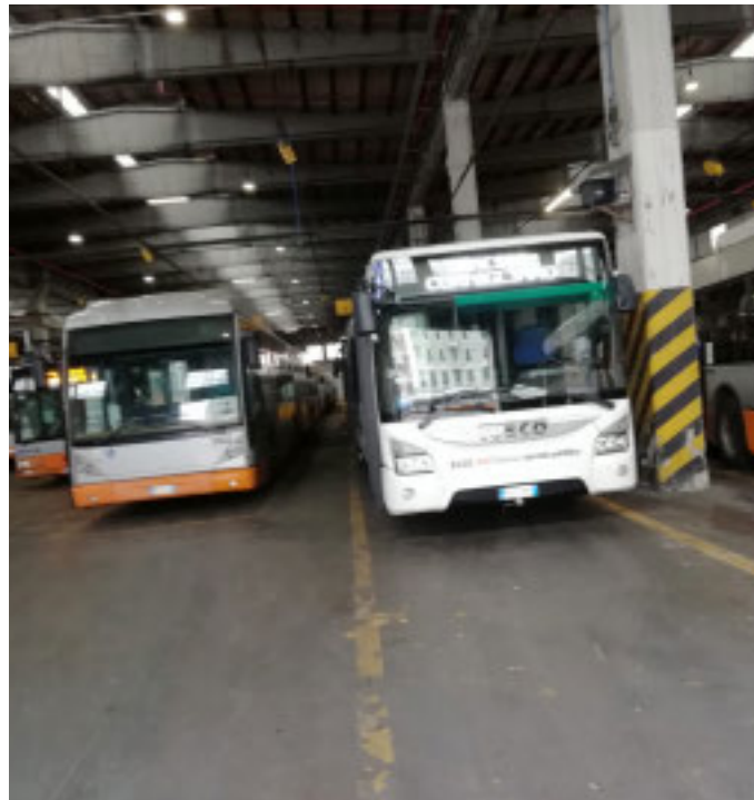
la situazione del trasporto pubblico a Genova non è facile

Il nuovo sistema di tariffazione Amt continua ad alimentare la discussione. La decisione della giunta Salis di eliminare la gratuità per gli over 70, a meno che non abbiano un Isee fino a 12mila euro all'anno, ha creato malumori in una grande parte di anziani che superano magari di poco quella soglia e che erano abituati a prendere il bus per una o due fermate. «L'indice di vecchiaia del 2024 per il Comune di Genova ci dice che ci sono 270,5 anziani ogni 100 giovani. Ebbene saranno proprio loro, gli anziani genovesi, a partire da un misero Isee di 12.000 euro, a doversi sobbarcare l'impatto economico più significativo di questa manovra, peraltro non preventivamente condivisa né col Garante dei diritti degli Anziani, né coi sindacati, né con le associazioni degli utenti, né col Consiglio della Città Metropolitana all'uopo sconvocato, né coi sindaci dei comuni delle valli, del Tigullio e della provincia di Genova, non a caso sul piede di guerra proprio per questo. Altro che linea condivisa, ascolto e parteci-