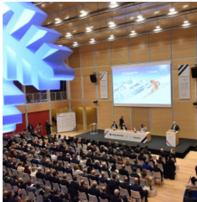
Un momento della presentazione

delle più importanti aree turistiche del mondo e generano un'offerta che si può articolare in tutte le stagioni dell'anno consentendo di raggiungere i 500 km di piste, di superare il limite della stagionalità.