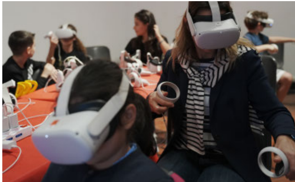
Imparare giocando: la scienza non è mai stata così divertente

Oggi una delle giornate più dense del programma, con incontri speciali, tanti laboratori e storie su cui riflettere