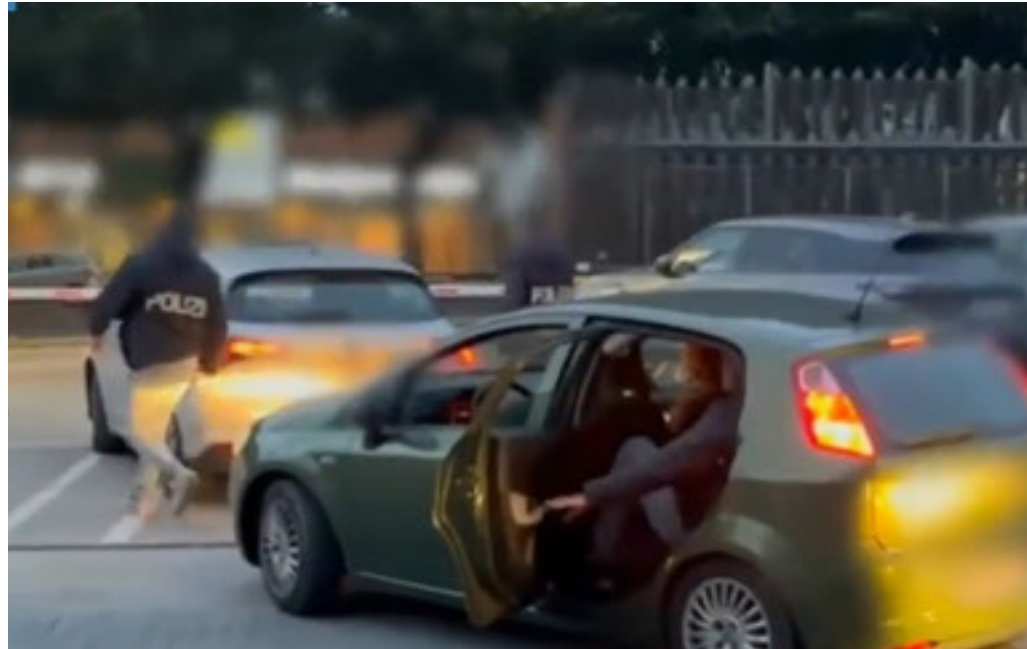
Secondo l'accusa era coinvolto anche nell'invio di un plico esplosivo

Sentenza torinese eseguita: dovrà scontare adesso 4 anni e 5 mesi di reclusione. Esulta Forza Italia