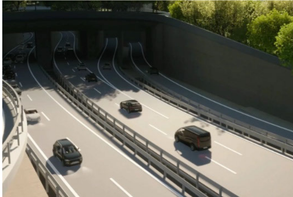
Un render del tunnel subportuale di Genova