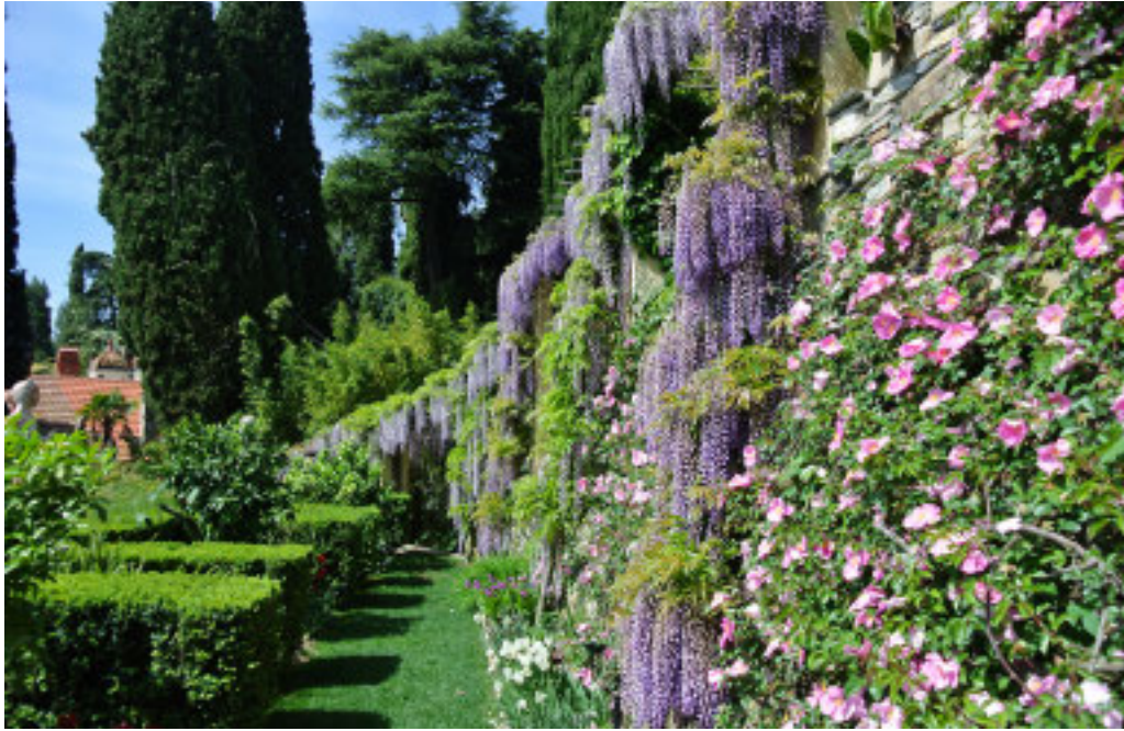
Uno scorcio di Villa della Pergola ad Alassio