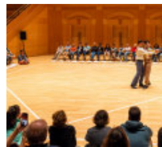
«Save the last dance for me»

spositivo, l'artista invitato e il pubblico condividono uno spazio in cui il respiro diventa elemento centrale, guidato da stimoli sonori ricevuti in cuffia. L'opera mette in discussione il controllo dell'atto performativo e le gerarchie tradizionali, favorendo un'esperienza basata sull'ascolto, sulla vulnerabilità e sulla relazione immediata. Sempre il 26 marzo è in programma l'unica replica di «Asteroid» di Marco D'Agostin, vincitore del Premio Ubu 2025 come miglior spettacolo di danza. Il lavoro è un originale omaggio al musical, inteso come forma capace di intrecciare intrattenimento e profondi-