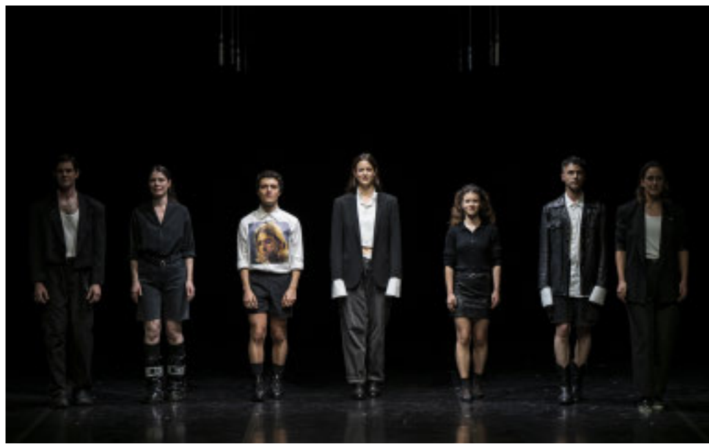
«U. (un canto)» uno dei due spettacoli presentati da Alessandro Sciarroni

Da oggi al 29 marzo il Teatro della Tosse ospita una settimana intensiva dedicata alle performing arts, configurandosi come un articolato percorso tra linguaggi contemporanei, sperimentazione e memoria culturale. Il cuore della programmazione è la rassegna internazionale "Resistere e Creare", giunta alla dodicesima edizione, affiancata da eventi e focus che coinvolgono artisti di primo piano della scena nazionale e internazionale. L'intero progetto si sviluppa in diversi spazi teatrali e cittadini, proponendo una riflessione ampia sulle possibilità espressive del corpo, della voce e della relazione performativa. Da oggi al 26 marzo sono protagonisti Alessandro Sciarroni , Leone d'Oro alla carriera per la danza 2019, Marco D'Agostin , vincitore di tre Premi Ubu, e Salvo Lombardo . I tre artisti, pur con poetiche autonome, condividono una ricerca che si colloca al confine tra teatro, danza e musica, lavorando sulla riattivazione di repertori esistenti e sull'indagine delle dinamiche relazionali e affettive. Le loro opere interrogano il presente attraverso pratiche che mettono in gioco memoria, resistenza culturale e trasformazione dei linguaggi. Sciarroni presenta due lavori significativi. Stasera, alle 20.30 Sala Aldo Trionfo, in scena «U. (un canto)»: una drammaturgia musicale che rilegge il repertorio corale italiano dal 1968 a oggi, tra-